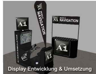
Display Entwicklung & Umsetzung