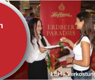
LEH - Verkostung